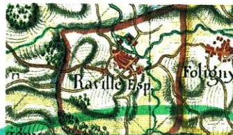
Un château, une église, un gibet, le bon vieux temps ?