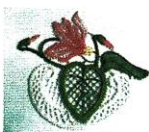
Cyclamen en dentelle

associée avec 3 paroisses de l'arrondissement de Boulay jusqu'en l'an 2000, date à laquelle elle rejoint le secteur de Courcelles-Chaussy.