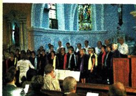
Concert de chant choral et instruments

La population active exerce à l'extérieur, essentiellement sur la zone messine et celle des charbonnages. Il ne reste plus que trois exploitations agricoles dans la commune.